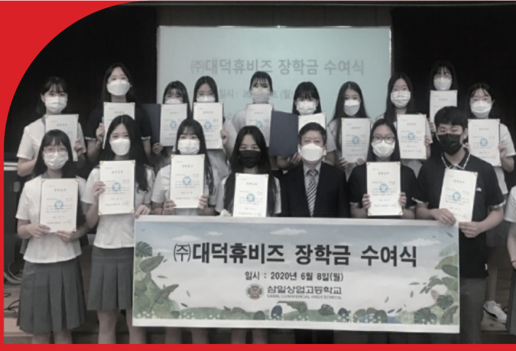
고등학교 장학금 지원