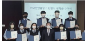
수원 삼일상고 졸업등문 모교사랑에 코로나19 장학금 2천도