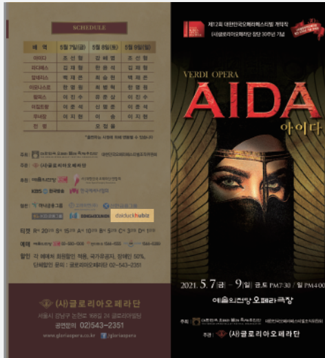
한국 메세나협회 후원