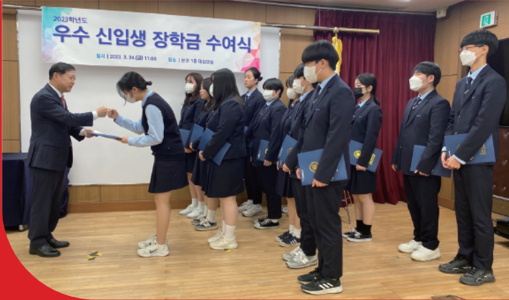
고등학교 장학금 지원